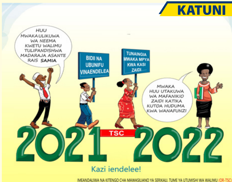
IMEANDALIWA NA KITENGO CHA MAWASILIANO YA SERIKALI. TUME YA UTUMISHI WA WALIMU (OR-TSC)

Wasiliana nasi kwa Simu: +255 782 366 622 & +255 735-255238 Barua Pepe: secretary@tsc.go.tz Au fika Ofisi ya Mawasiliano, Tume ya Utumishi wa Walimu (TSC), Mtaa wa Mtendeni, S.L.P 353, DODOMA.