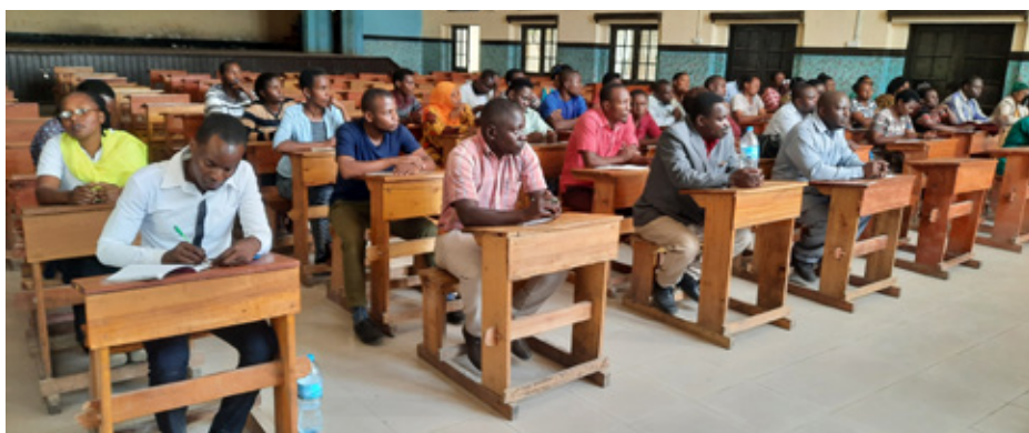
Baadhi ya Walimu waliohudhuria kikao.