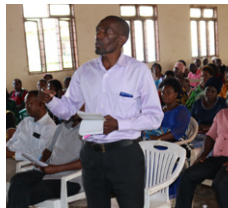
Mmoja wa walimu wa Jiji la Mbeya akiuliza swali katika mkutano uliowakutanisha viongozi wa TSC na baadhi ya walimu wa jiji la Mbeya.