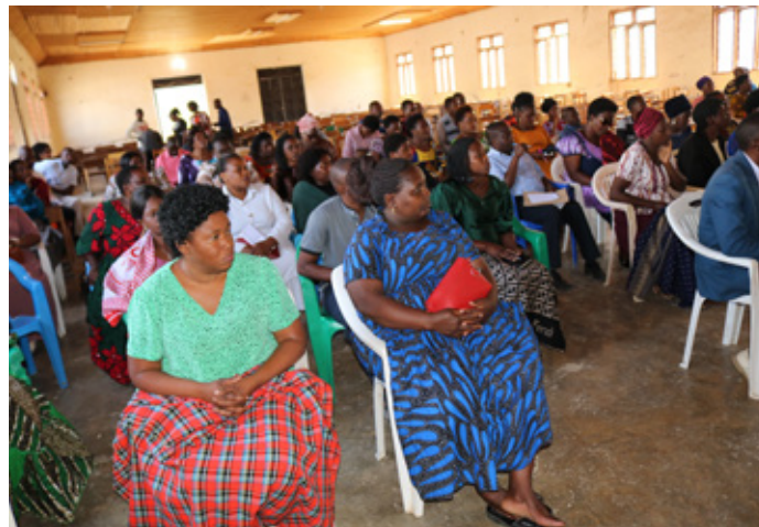
Badhi ya Walimu wa Fiji la Mbeya waliohudhuria Mkutano wao na viongozi wa TSC Makao Makuu.