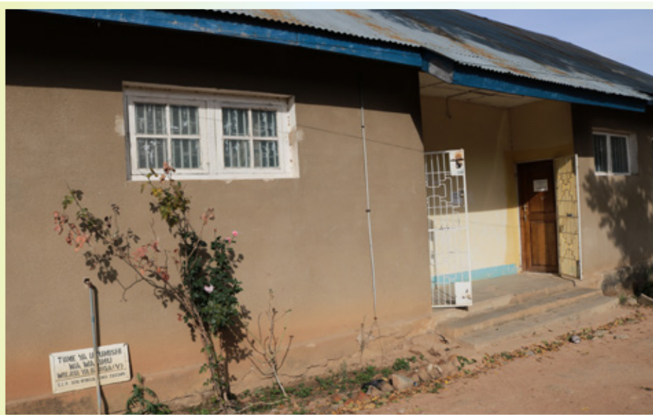
Picha ya jengo la TSC Wilaya ya Iringa

TSC Wilaya ya Iringa inasimamia walimu katika Halmashauri mbili ambazo ni Halmashauri ya Manispaa ya Iringa yenye walimu 1404, shule za msingi 43 na sekondari 16 pamoja na Halmashauri ya Wilaya ya Iringa yenye walimu 2114, shule 148 za msingi na 31 za sekondari za Serikali.